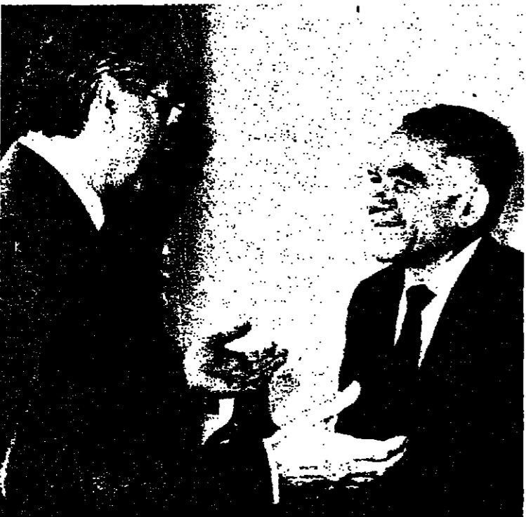
السيد شمير يتحدث إلى نظيره الإيطالي خلال اجتماعهما أمس في جنسوى وزارة الخارجية الإيطالية

روما - اجتمع السيد إسحق شامير وزير الخارجية في روما أمس مع نظيره الإيطالي السيد أميليو كولومبو. وصرح السيد شامير بعد الاجتماع بأن مباحثاتهم مع السيد كولومبو كانت إيجابية ومهمة وأضاف أنه أطلع الوزير الإيطالي على موقف إسرائيل وعلاقتها مع دول أوروبا الغربية. وقال السيد شامير إن إسرائيل قد قبلت الدعوة وسيدعو مبعوثها إلى جنسوى في روما.